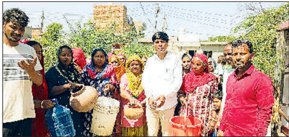
सोनीपत। विशेष प्रदर्शन करते कॉलोनीवासी।