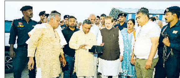
गोहाना। गेहूं में नमी की जांच करते हुए मंत्री डॉ. अरविंद शर्मा।

फसल खरीद और उठान की प्रक्रिया में कोई परेशानी न होने दी जाए और खरीद प्रक्रिया को पारदर्शिता से पूरा किया जाए। मंडी से समय पर गेहूं की बोरियों का उठान किया जाए।