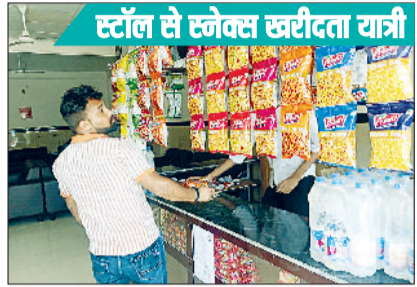
स्टॉल से स्नेक्स खरीदता यात्री