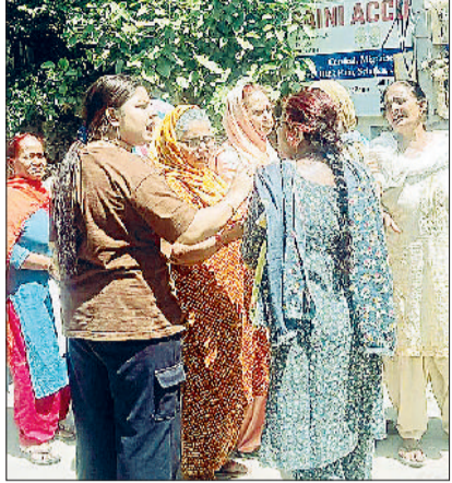
सोनीपत। लाइन में नोकझोंक करती महिलाएं।

दो माह का गेहूँ भेजा दिमाग में सभी सरकारी राशन डिपुओं पर दो माह के गेहूँ की आपूर्ति शुरू कर दी है। कई जगह कार्ड धारकों को दो माह का गेहूँ वितरण शुरू हो चुका है। इसके अलावा तेल व चीनी का केवल अप्रैल माह का ही वितरण किया जा रहा है। सभी डिपो तक राशन पहुंचने में थोड़ा समय लगता है। जल्द ही सभी उपभोक्ताओं को राशन वितरित कर दिया जाएगा। -विशेष सहरावत, जिला खाद्य आपूर्ति नियंत्रक