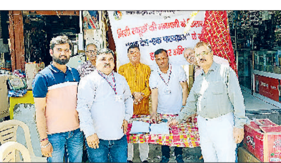
सोनीपत। हस्ताक्षर अभियान के दौरान संस्था के पदाधिकारी एवं सदस्यगण।