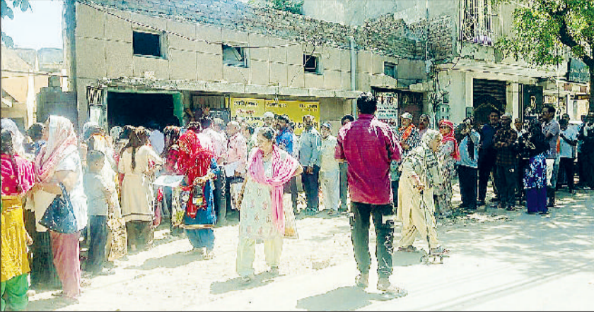
सोनीपत। मॉडल टाउन में डिपो पर राशन लेने के लिए लगी कतारें।

राशन नहीं देने पर होगी कार्रवाई विभाग का कहना है कि यदि किसी डिपो पर राशन वितरण में देरी, कटौती या अन्य कोई समस्या सामने आती है, तो उपभोक्ता तुरंत इसकी शिकायत दर्ज करवा सकते हैं। उपभोक्ता पीओएस मशीन पर अंगूठा लगाकर अप्रैल व मई दोनों माह का निशुल्क गेहूँ प्राप्त कर सकते हैं। इसके अलावा अप्रैल की चीनी 15 रुपये और सरसों का तेल लीटर प्रति राशन कार्ड 30 रुपये प्रति लीटर व 2 लीटर प्रति राशन कार्ड 100 रुपये प्रति लीटर की दर से 30 अप्रैल तक ले सकते हैं। अधिकारियों के अनुसार कोई भी डिपोधारक राशन कार्ड धारकों को कम व अधिक