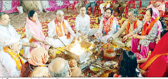
सोनीपत। यज्ञ के दौरान शामिल श्रद्धालुगण।