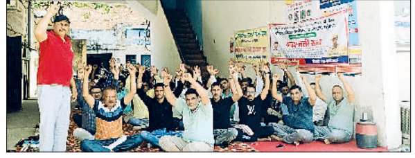
सोनीपत। नगर निगम कार्यालय परिसर में हड़ताल के दौरान धरने पर बैठे अग्निशमन विभाग कर्मचारी यूनिन के सदस्य। फोटो: हरिभूमि

सोनीपत। खन्ना कॉलोनी में पेयजल कनेक्शन के नाम पर उखाड़ी गई सड़क। फोटो: हरिभूमि